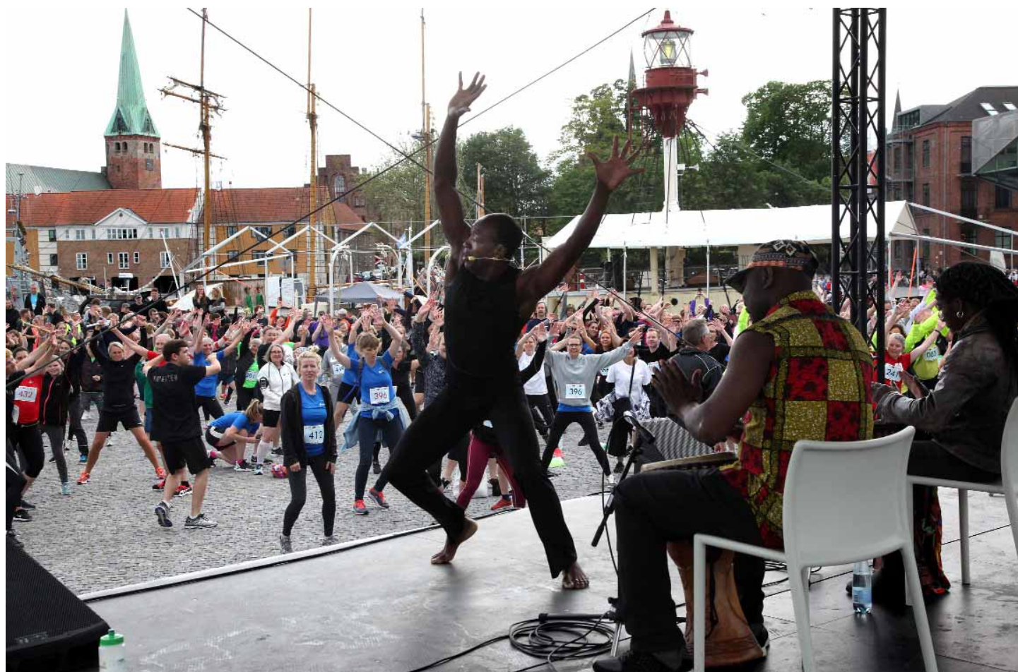
Fuld gang og god stemning i opvarmningen