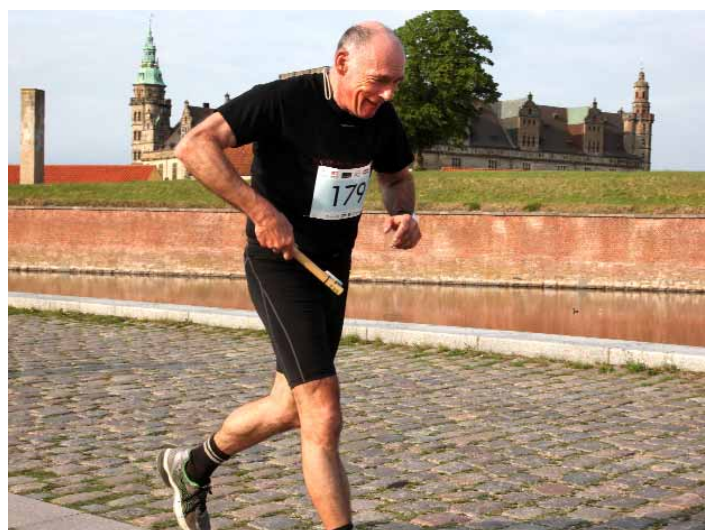
Maleren i sin kendte løbestil