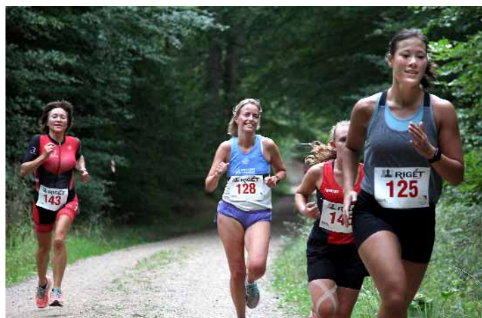
Førertruppen fra sidste år