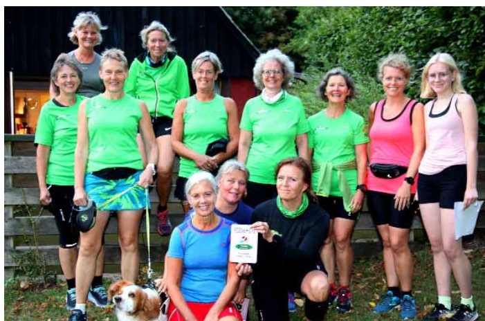
Sidste års holdvindere