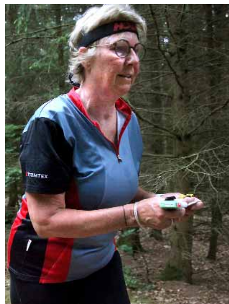
Dicte blev sikker vinder af dameklassen