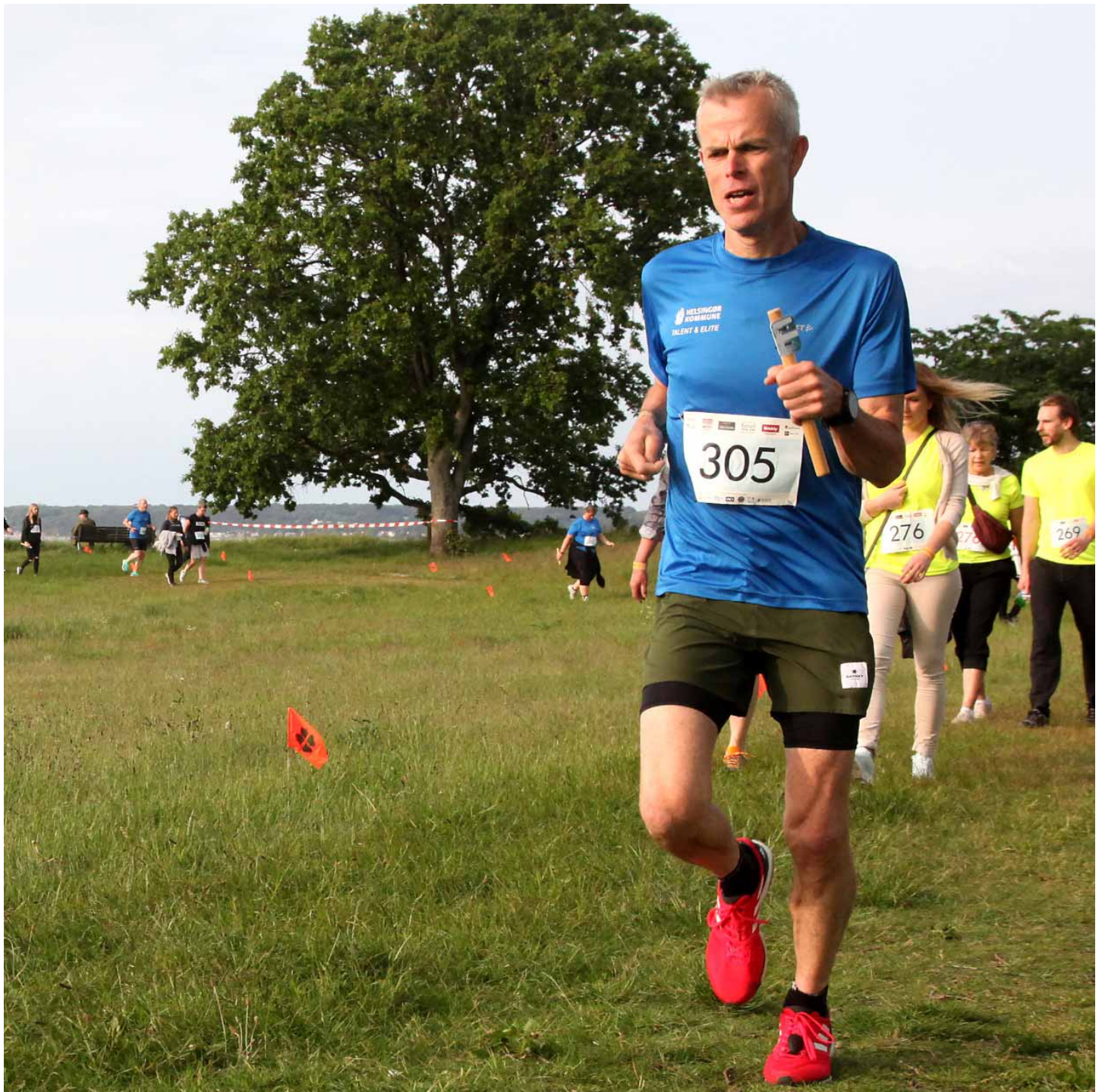
Arhning ved at være i mål