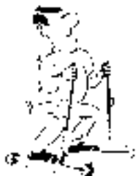
--Rul med Holm-sport!