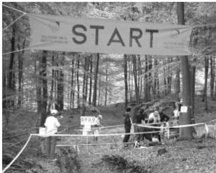
Foran ligger skoven - stor og skræmmende?

Er det noget du kan genkende, er det måske en idé at læse videre.