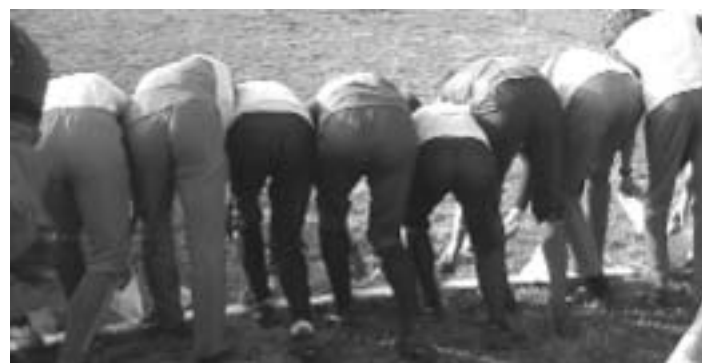
Starten ved en stafet er specielt stressende.

Når kortet ligger foran dig, tillader jeg mig at lige at bøje et hjørne og for at se hvordan det er vendt. Jeg lægger det så det er nordvendt i det øjeblik jeg vender kortet. I forvejen ved jeg fra kigget på arrangørernes kort, i hvad del af kor-