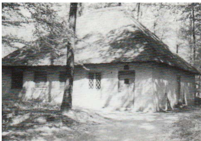
Teglstrup Hegn vandværk

Når vi løber ad Gl. Hellebækvej forbi golfbanen og det åbne stykke møder vi pottelersbakken, hvor der er rester af 4 teglovne fra det 16. århundrede alle fredet, derefter kommer på højre hånd en lille bevokset høj hvor det gamle vandværk nedrevet i 1972 lå.