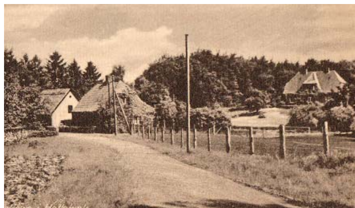
Skovløberboligen i Hellebæk

Det blev genopført i 1936 og er nu privatbolig for en lille familie.